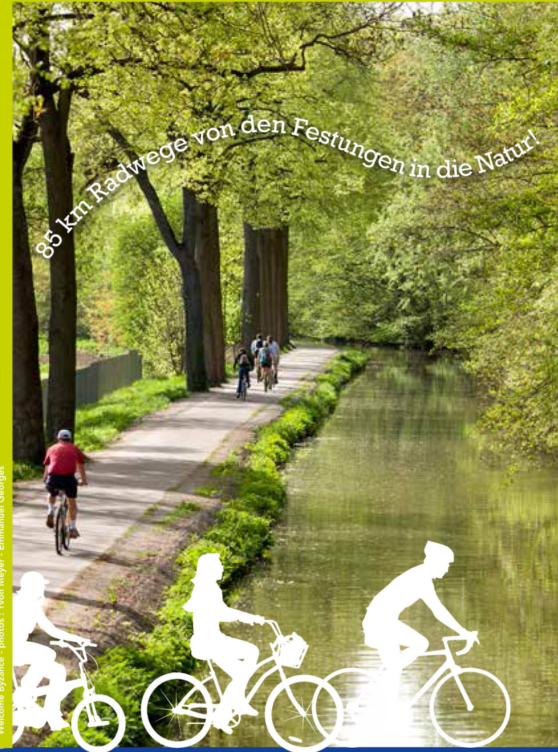
Welcome Byance - photos : Yvon Meyer - Emmanuel Georges