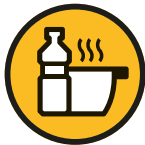
Huile de friture