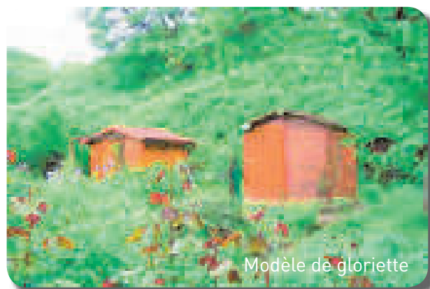
Modèle de gloriette

Les pavillons sont déjà revêtus d'une lasure, il est précisé, qu'à l'avenir et pour toute remise en peinture, que la seule teinte autorisée est le brun. Il est vivement conseillé de ne pas garnir les gloriettes de plantes grimpantes.