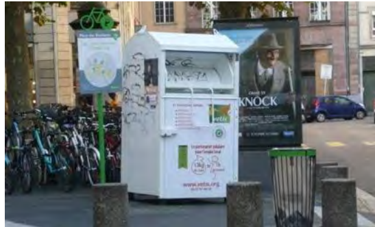
Place des Etudiants