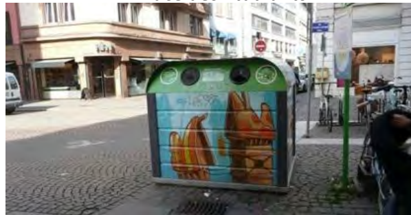
Rue du 22 Novembre