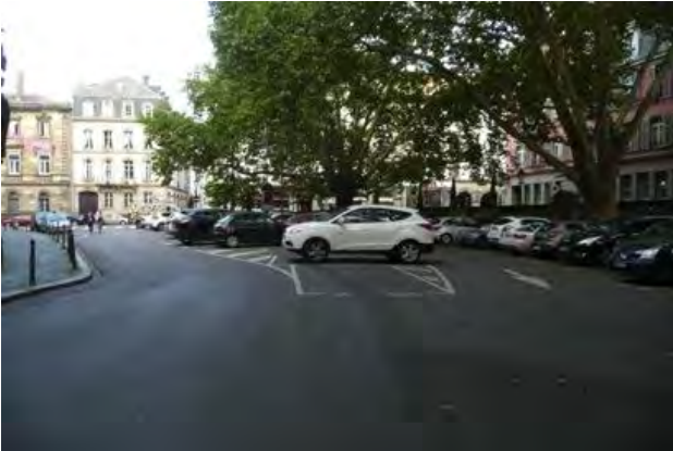
Place Saint Pierre-le-Jeune