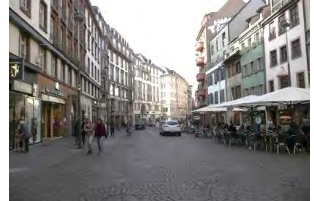
Exemple de la rue du 22 Novembre