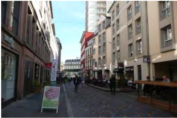
Rue du Jeu des Enfants