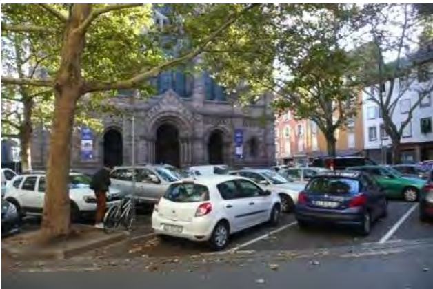
Place du Temple Neuf