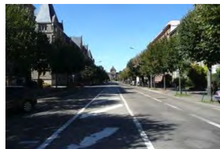
Avenue de la liberté