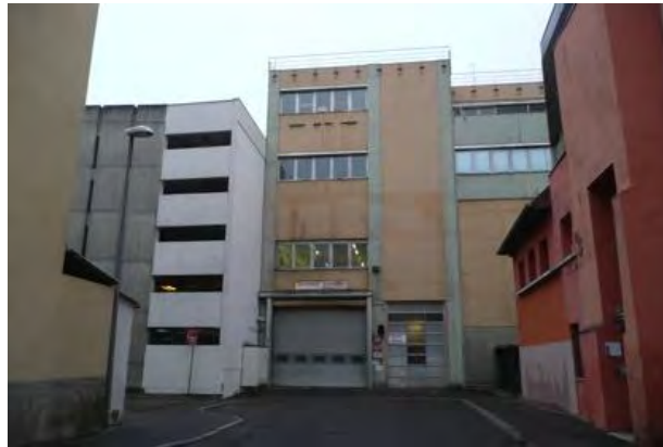
Secteur DNA – arrière place Broglie