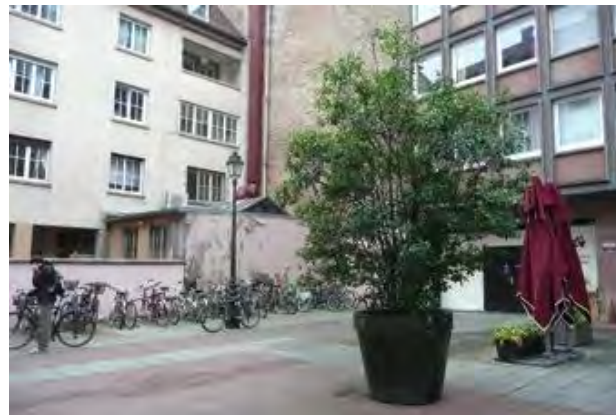
Placette rue du Saumon