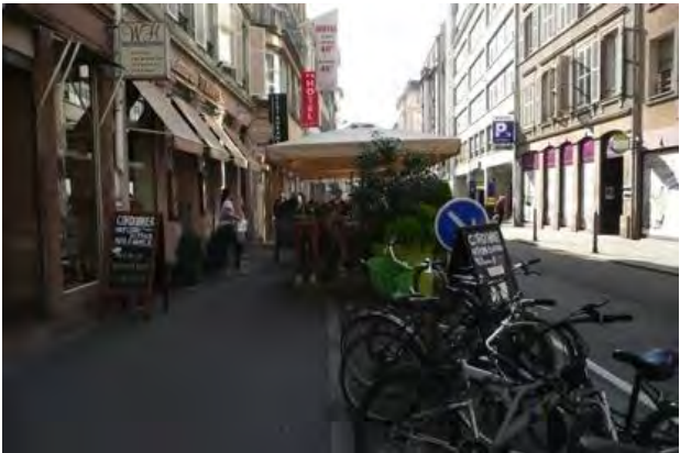
Rue du Fossé des Tanneurs