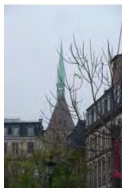
Depuis la rue des Grandes Arcades Saint Pierre-le Jeune