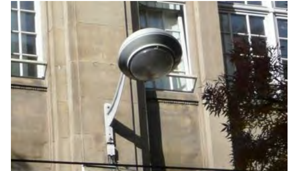
Rue du Vieux Marché aux Vins