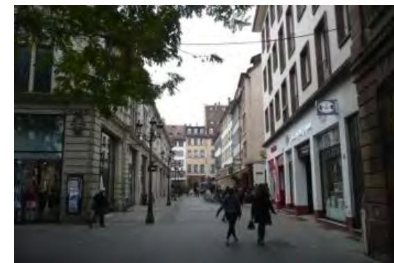
Rue du Vieux Marché aux Grains