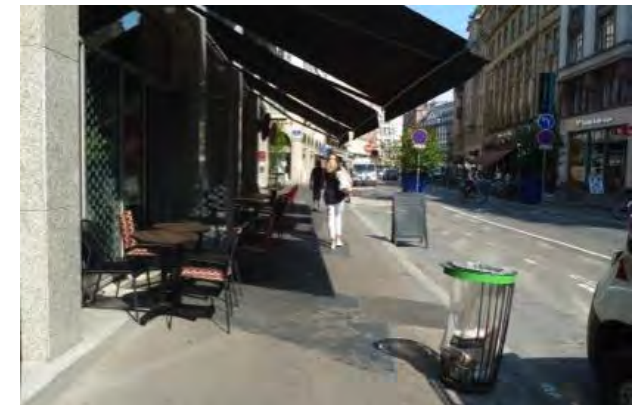
Séquence Place Kléber-rue du Fossé des Tanneurs