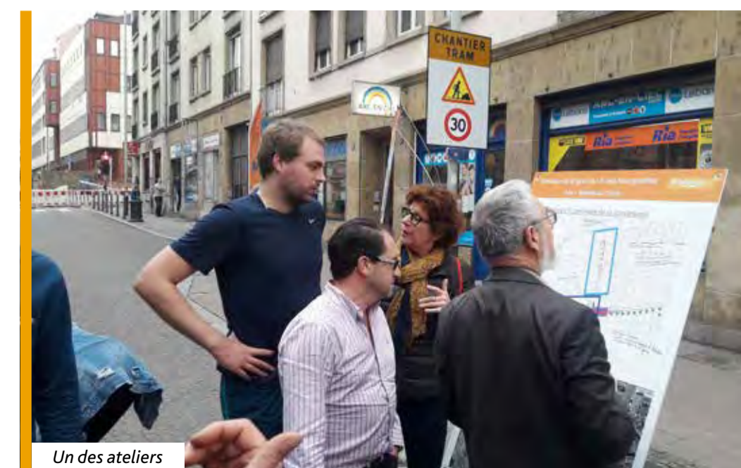
Un des ateliers