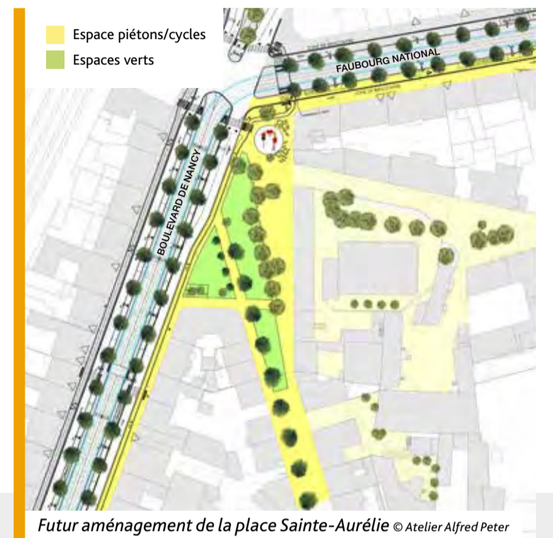
Futur aménagement de la place Sainte-Aurélie © Atelier Alfred Peter