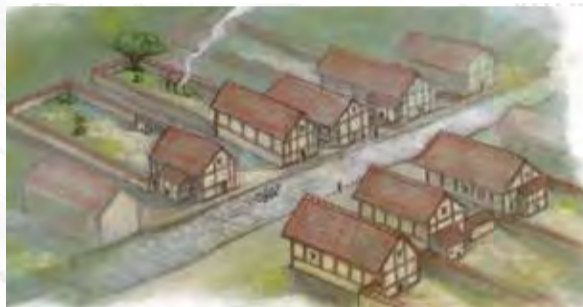
L'habitat © Ch. Courivaud infographie