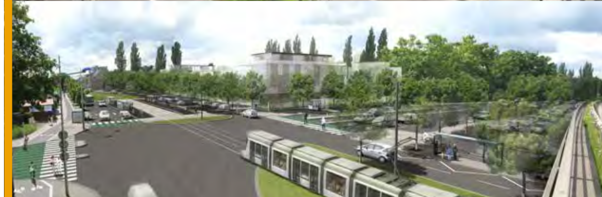
Vue sur le parking relais 1, depuis le pont de l'autoroute vers Koenigshoffen, avant et après les travaux