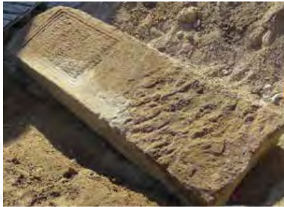
Stèle funéraire

L'habitat se présente sous la forme de bâtiments en terre et bois, de plans allongés, pignons donnant sur la rue. À l'arrière de ces bâtiments se développaient des cours et jardins dotés de structures d'équipement (latrines, puits, foyers, fosses de stockage, celliers...).