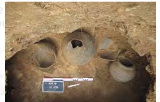
Les fours et leurs productions

La zone ouest de la fouille comportait les restes de cinq fours de potiers actifs entre la fin du II e siècle et le III e siècle. On recense un four de plan quadrangulaire, deux à chambre circulaire et un à chambre ovale. La production semble être spécialisée dans la fabrication de pots à cuire ou de stockage, de jattes à bord, de gobelets et de cruches de grand module imitant des amphores. Des restes (scories, creusets) correspondant à une activité métallurgique ont été enregistrés à l'est de la fouille.