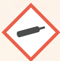
Gaz sous pression