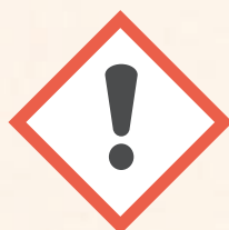
Dangereux pour la couche d'ozone et pour la santé