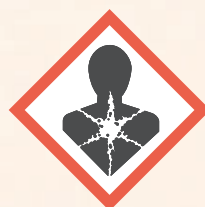
Très dangereux pour santé