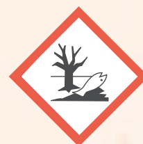
Dangereux pour l'environnement aquatique