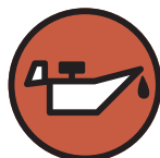
Huile de vidange