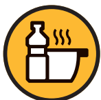
Huile de friture