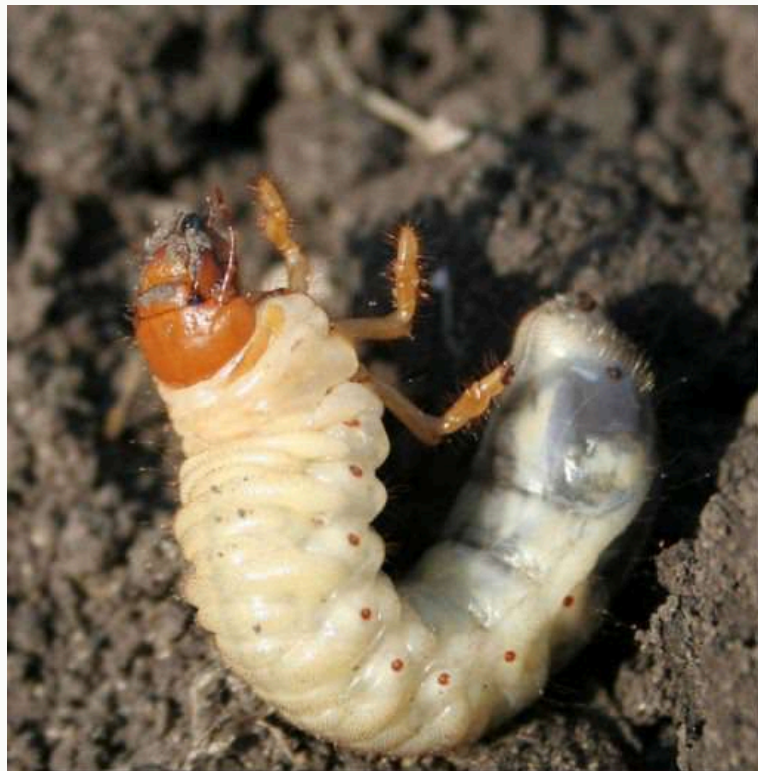
Larve de hanneton