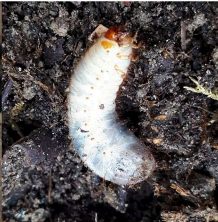
Larve de cétoine