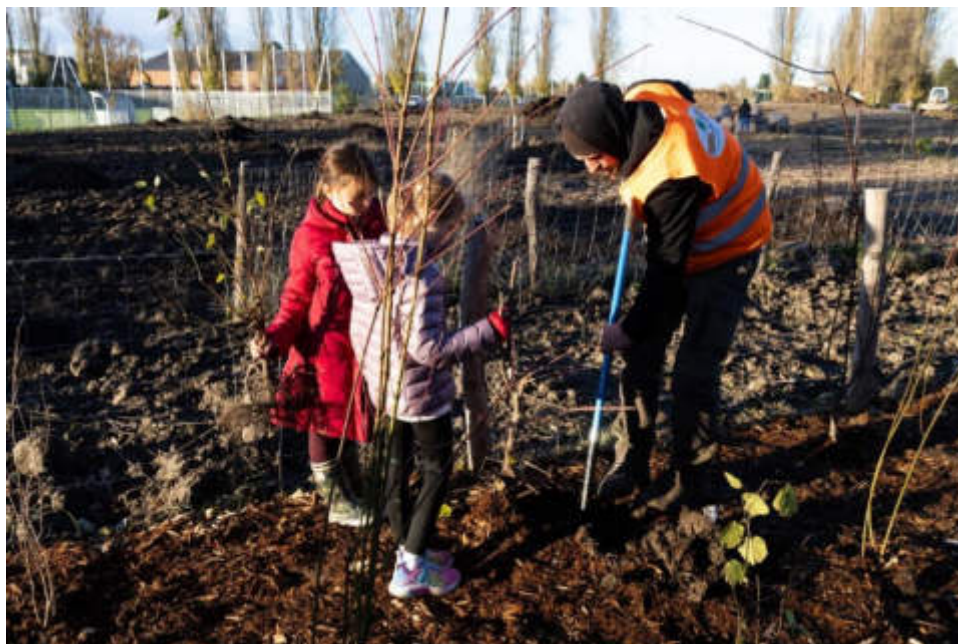
Les premières plantations du futur Parc des Romains.

De nombreuses plantations ont pu se concrétiser grâce aux suggestions des habitants-es via le bouton de propositions pour « planter un arbre » à disposition sur le site de la ville de Strasbourg : demarches.strasbourg.eu/environnement/suggestion-plantation-arbre . On en dénombre plus de 500 depuis 2020.