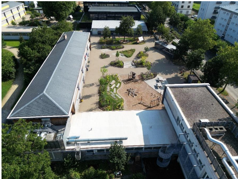
Cour de l'école maternelle Canardière après les travaux, 125 élèves concernés

La Ville de Strasbourg est pionnière en France en matière de transformation des cours d'école par le prisme du genre. Ainsi, la collectivité porte le projet de réaménager l'espace pour favoriser l'égalité fille/garçon dès le plus jeune âge tout en accompagnant le personnel éducatif pour sensibiliser et faire émerger une nouvelle utilisation de l'espace public pour les générations à venir.