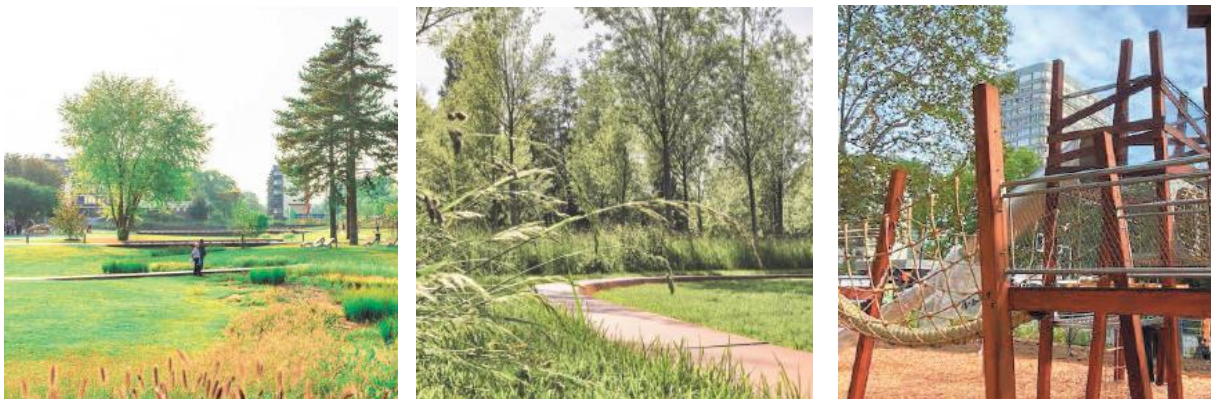
Illustrations de principe du futur parc Crédits : Ingerop/DeA/ K&+/Acte2 Paysage

Cet aménagement paysager d'ampleur sous maîtrise d'ouvrage de la ville de Strasbourg profite de subvention de la Région Grand Est (1,5 M€) et de l'Agence de l'Eau Rhin Meuse (900 k€) dans le cadre de sa gestion différenciée et intégrée des eaux pluviales et de son rôle majeur dans la trame verte et bleue de la ville et de l'Eurométropole de Strasbourg.