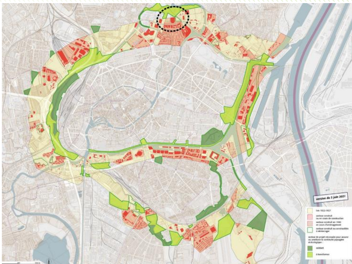
Le projet urbain Archipel dans la Ceinture verte de Strasbourg