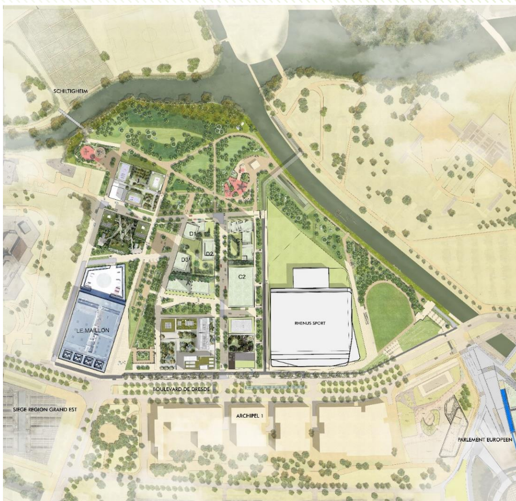
Plan d'aménagement d'ensemble / Crédit : K et + / Acte 2 paysage