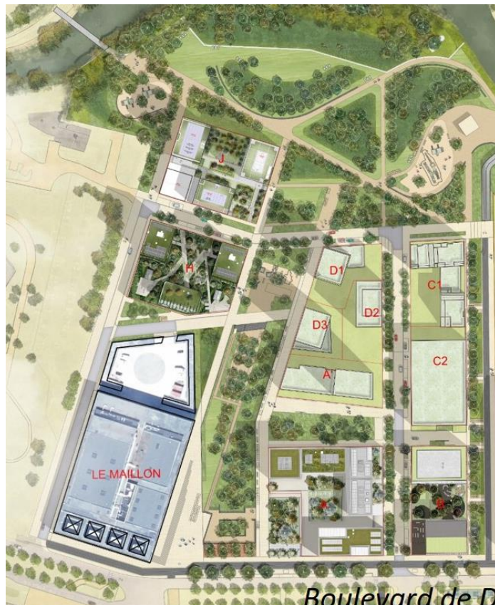
Archipel 2 - Plan de repérage des lots_ Acte 2 paysage