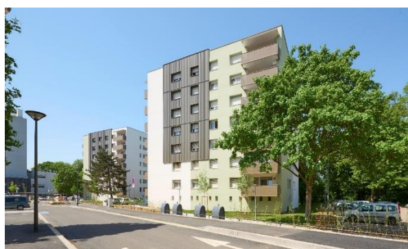
Bâtiments n°20 et 22 Rue de Mâcon, ayant bénéficié de travaux d'agrandissement des balcons et d'aménagements extérieurs (notamment poubelles enterrées)