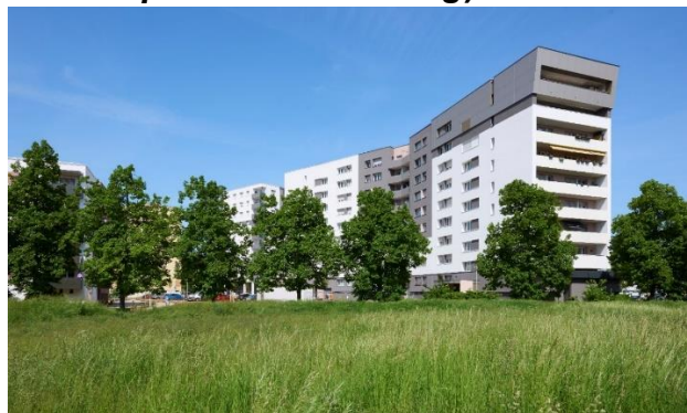
Bâtiment « Signal » n° 1,3 et 5 Rue de Mâcon – Vue depuis l'Avenue du Neuhoef