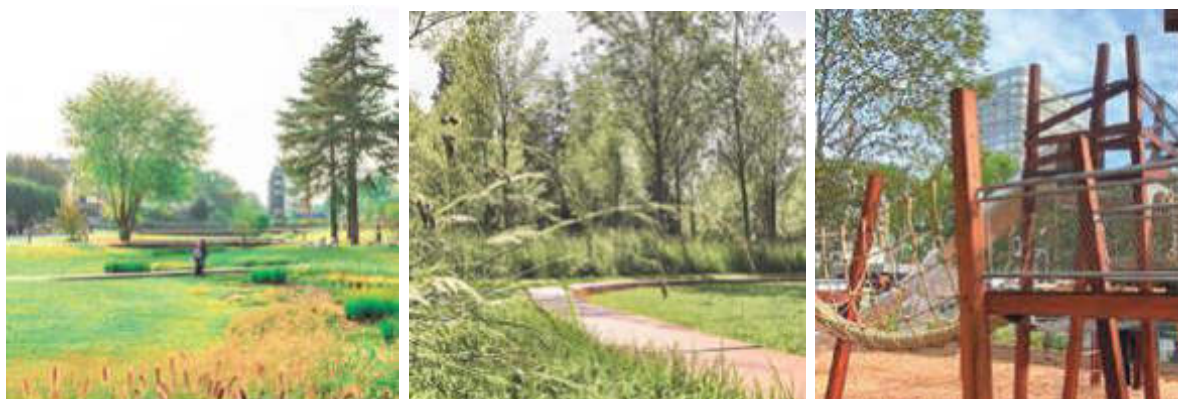
Illustrations du futur parc

Un projet « label bas carbone » est un projet de réduction d'émissions et de séquestration carbone. Les impacts de ces projets sont mesurés et génèrent des crédits carbone. Les entreprises et organisations qui le souhaitent peuvent financer ces projets afin de contribuer à une démarche de décarbonation de leurs structures, renforcer leurs démarches RSE et valoriser leur ancrage territorial en soutenant ces projets de proximité contribuant directement à la lutte contre le changement climatique.