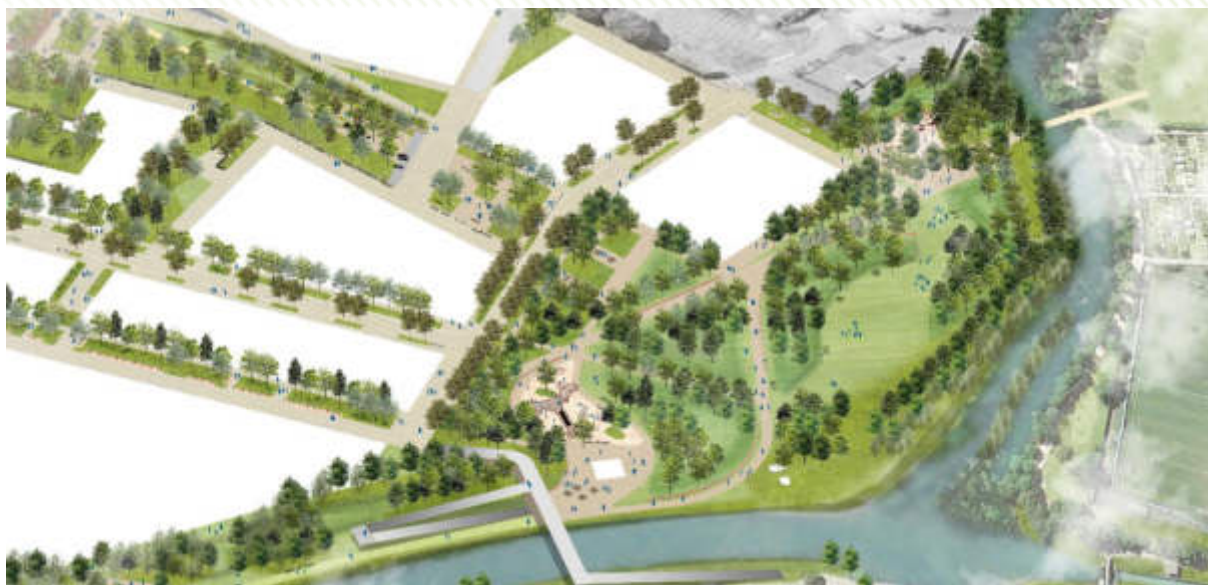
Le futur parc sur le quartier Archipel 2

À l'automne 2020, la collectivité a fait le choix de réorienter Archipel 2, par rapport à la programmation initiale. Les ambitions fixées pour ce nouveau quartier ont été revues dans l'objectif d' aller plus loin en matière d'écologie urbaine, d'inclusion et d'excellence environnementale pour répondre aux enjeux du territoire.