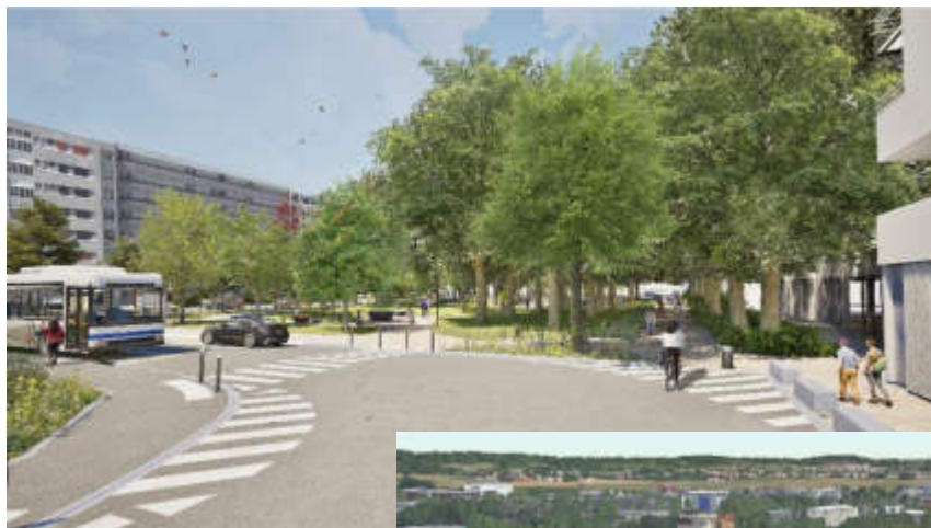
Visuels de la future place. © Ingérop & WeScape