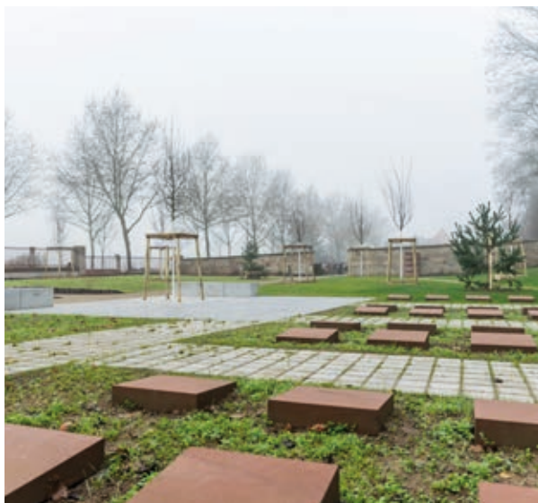
Des urnes cinéraires sont enterrées et recouvertes d'une dalle de grès.