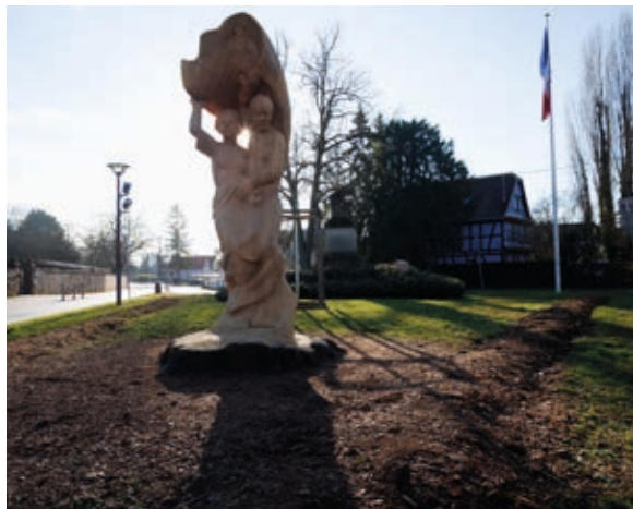
L'artiste Antoine Halbwachs a signé la sculpture.

de 22 mètres de hauteur était devenu dangereux. Après la coupe de racines pour aménager une piste cyclable et la chute de plusieurs branches, la municipalité s'est résolue en juillet 2024 à élaguer l'arbre, ne laissant qu'un tronc de trois mètres de haut. Pour mettre en valeur cette relique historique, la municipalité s'est tournée vers le sculpteur connu pour avoir notamment réalisé l'ours surplombant la rue du Noyer à Strasbourg. «J'ai travaillé sur les valeurs de la République, sur ce qui nous réunit», explique Antoine Halbwachs. Trois mois de taille jusqu'en novembre 2025, date de l'inauguration de l'œuvre, ont été nécessaires pour représenter un couple protégé par un drapeau tricolore. Un nouveau tilleul a également été planté en mars 2024 aux côtés de son illustre prédécesseur pour perpétuer le symbole républicain. ➔ Olivia Kouassi