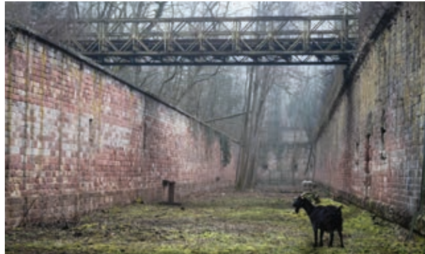
Les Veilleurs du fort Joffre recherchent toujours des bénévoles et des mécènes.

La commune a fait l'acquisition de l'ouvrage fortifié, qui fait l'objet d'un chantier de réhabilitation par une association.