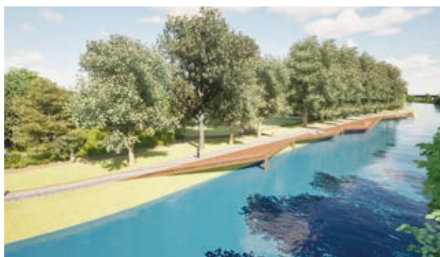
Le parc intégrera des terrasses sur l'Ill.