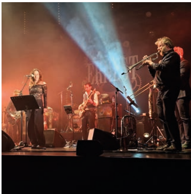
Le groupe strasbourgeois Ernest Orchestra a été programmé à l'automne 2025.