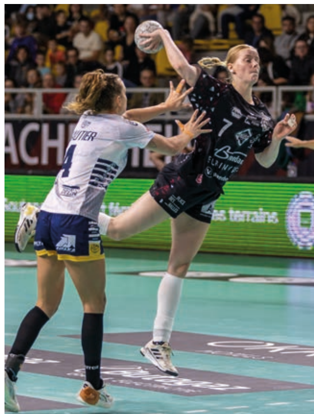
La SATH jouera ses matchs de février et avril au Rhenus.