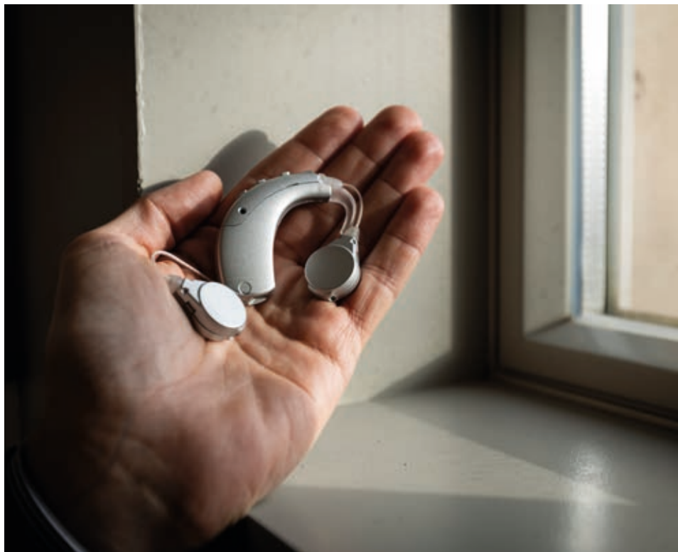
La production de l'appareil auditif de Sounduct pourrait bénéficier au marché européen en 2027.