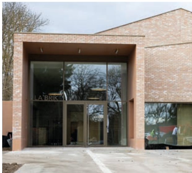
Le nouvel équipement a été baptisé la Brik.