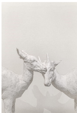
Rembrandt Bugatti, Mes antilopes, 1909. Plâtre. Strasbourg, MAMCS.