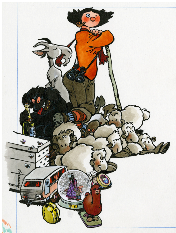
F'murrr, projet d'affiche pour la fête de la Transhumance de Die 1994, s.d. Musée Tomi Ungerer – Centre international de l'illustration, dépôt de la Bibliothèque nationale de France © succession F'murrr

L'exposition montre comment F'murrr a réalisé sa première histoire longue pour À suivre ( Jehanne et Tim Galère ) et comment ses illustrations ont été influencées par l'univers pastoral. Ses dessins de presse des années 1980 sont également abordés ainsi que son intérêt pour l'Histoire avec Notre Histoire et Mélusine et la représentation des femmes, qu'il poursuit