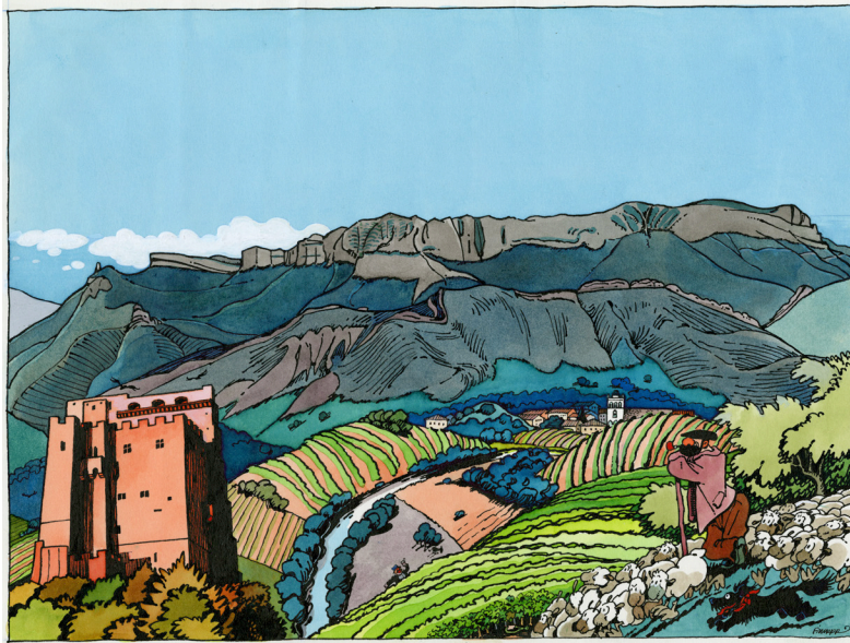
F'murrr, Vallée de la Drôme , 1993 Musée Tomi Ungerer - Centre international de l'illustration, dépôt de la Bibliothèque nationale de France © succession F'murrr

Une invitation a été faite à Camille Potte, illustratrice contemporaine inspirée par l'univers médiéval de F'murrr, pour accompagner l'exposition.