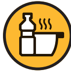
Huile de friture