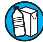
Tous les emballages ménagers