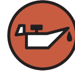
Huile de vidange