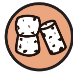
Bouchons en liège